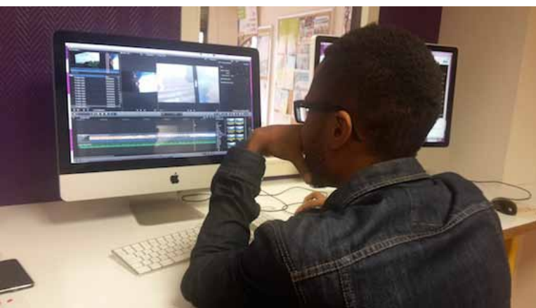
montage vidéo avec les imac du Blog46

Sur place au Blog46 Beauvais pour les jeunes de 16-25 ans dans la section 'Multimédia' Exemple d'utilisation sur le site web du Blog46 lien raccourci http://bit.ly/2ISmWVS